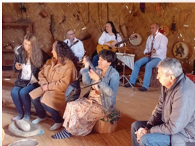
Participación “Círculo de Verdades” organizado por la Vicerrectoría Académica, Templo del Sol, Sogamoso, junio 24, 2022.

Estas propuestas quedaron sembradas, y desde ese entonces, el repertorio musical de Arcilla se ha enriquecido con la inclusión de mayor cantidad de temas del arraigo colombiano de las zonas Andina, Orinoquía, Caribe, Pacífica y Amazónica, haciéndonos eco de los sonidos de esta tierra natal, que han acompañado y alimentado nuestro crecimiento musical.