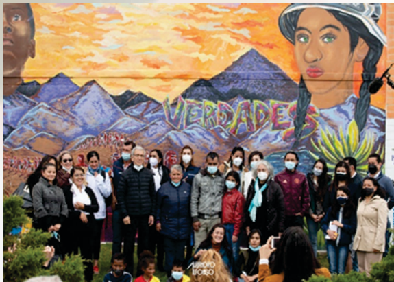
Entrega de murales “Verdades”, mural de los jóvenes y niñ@s del barrio Antonia Santos, 29 de agosto de 2021.

El Seminario permanente para la construcción de paz (Resolución 2070 de 2021) invita a la comunidad Upetecista a generar espacios de formación y encuentro de saberes que aporten a la construcción de una paz estable y duradera, con los retos que este ejercicio implica. La agenda institucional “Tejiendo Redes de Paz- 2022” ha permitido: visibilizar las acciones de la Comisión de la Verdad, Fundación para la Reconciliación, EDUCAPAZ, instituciones educativas de básica y media, la Vicerrectoría Académica y el Colectivo PaZalo Joven-Generación V+ Uptc a través de más de doce especiales de radio en el programa Saberes en Frecuencia gracias al apoyo de UPTC radio 104.1 FM. Círculos de verdades, talleres sobre cómo ser agentes de paz, foros, presentaciones en diferentes eventos académicos locales, institucionales, nacionales e internacionales han permitido avanzar en la sensibilización de docentes, estudiantes, funcionarios y sociedad en general acerca de la necesidad de escuchar las voces invisibilizadas por el conflicto armado y de pensarse como agentes constructor@s de paz.